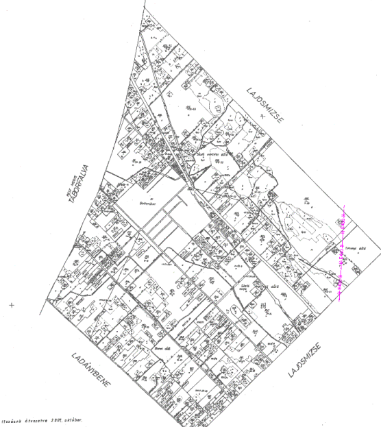
Ökológiai hálózat -folytonos folyosó (irányadó elem)